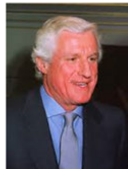
Friedrich Christian Flick

Die F.C. Flick Stiftung wurde im September 2001 von Dr. Friedrich Christian Flick gegründet. Im Gedenken an die Opfer und Überlebenden des nationalsozialistischen Terrorregimes, denen durch Menschenrechtsverletzungen schweres Unrecht zugefügt wurde, bekennt sich der Stifter zu der daraus erwachsenden historischen und